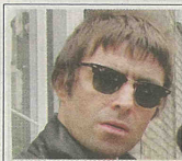
IL FRATELLO LIAM

Con Liam non ci parliamo. Non mi dispiace. Abbiamo avuto problemi sin dagli inizi degli Oasis